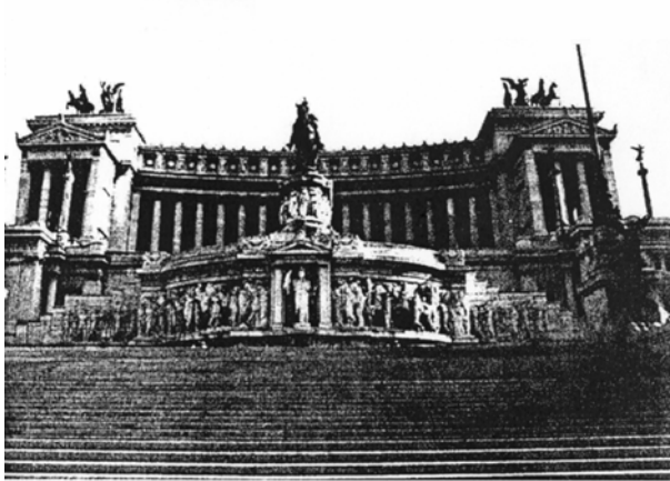
Figure 3 : Le Vittoriano, symbole de la difficile reproduction de la centralité romaine

Notons la massivité ostentatoire du monument à Victor-Emmanuel II, récupéré ultérieurement par le fascisme, ainsi que ses références à l'Antiquité