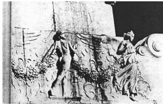
Le Vittorio illustre les ratés du volontarisme en matière de centralité urbaine